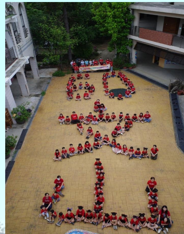
114 學年度文山國小 60 週年校慶前全校合影

這不僅是一場書展，更是一場關於傳承的對話。誠摯邀請校友、家長與同學們走進圖書館，在老式幻燈片的微光中，共同細品文山國小六十載的風華歲月。