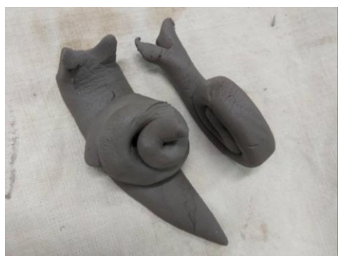
動物捏塑作品呈現