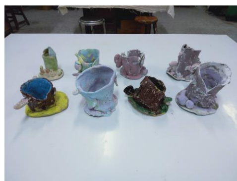
動物筆筒作品呈現